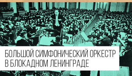
БОЛЬШОЙ СИМФОНИЧЕСКИЙ ОРКЕСТР В БЛОКАДНОМ ЛЕНИНГРАДЕ

Одновременно с этим ленинградцы всеми силами старались выжить и не дать умереть родному городу. Мало того: Ленинград помогал армии, выпуская военную продукцию - заводы продолжали работать и в таких условиях. Восстанавливали свою деятельность театры и музеи. Это было необходимо - доказать врагу, а главное самим себе: блокада Ленинграда не убьёт город, он продолжает жить! Один из ярких примеров поразительной самоотверженности и любви к Родине, жизни, родному городу является история создания одного музыкального произведения. Во время блокады была написана известнейшая симфония Д. Шостаковича, названная позже "Ленинградской". Вернее, композитор начал её писать в Ленинграде, а закончил уже в эвакуации. Когда партитура была готова, её доставили в осаждённый город. К тому времени в Ленинграде уже возобновил свою деятельность симфонический оркестр. В день концерта, чтобы вражеские налёты не могли его сорвать, наша артиллерия не подпустила к городу ни одного фашистского самолета! Все блокадные дни работало ленинградское радио, которое было для всех ленинградцев не только живительным родником информации, но и просто символом продолжающейся жизни.